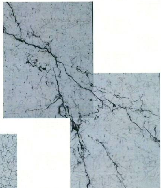
オーステナイト系ステンレス鋼において 発生した応力腐食割れ