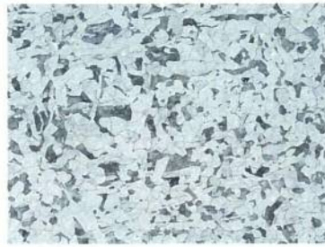
炭素鋼の金属組織