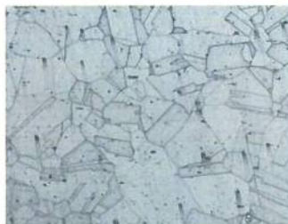
オーステナイト系ステンレス鋼の 金属組織(固溶化組織)