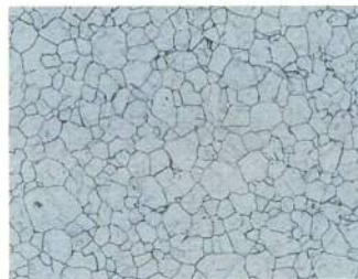
オーステナイト系ステンレス鋼の 金属組織(鋭敏化組織)