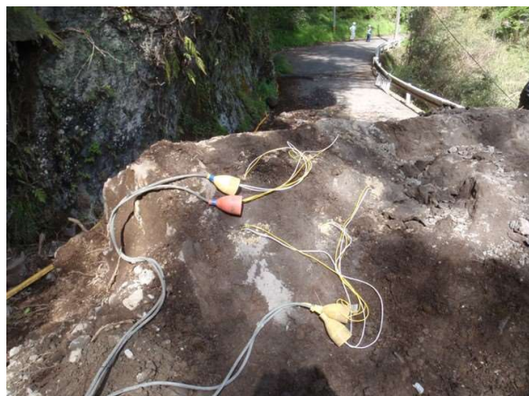
エコリッジ装填状況