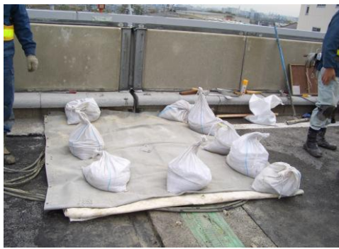
4 防爆・防音シート養生