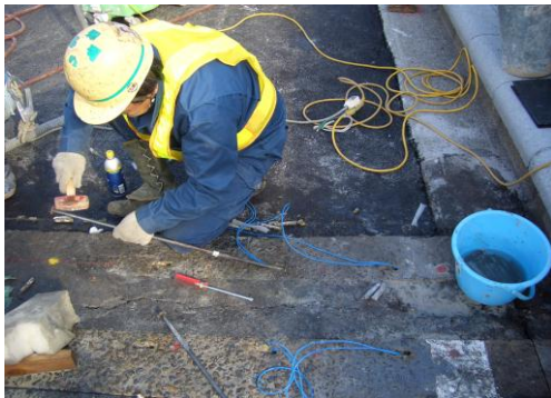
3 カートリッジ装填