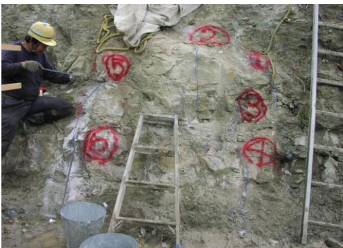
2 カートリッジ装填