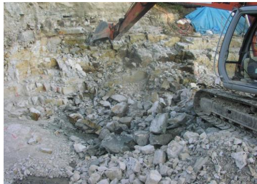
5 破砕部整形 (ブレーカ)