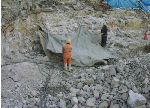
3 防音・防音シート設置